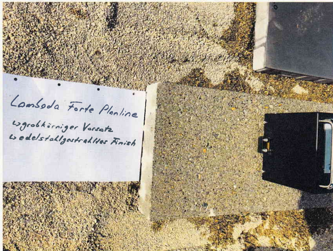
Bild 1. Die zu prüfende Betonoberfläche Terrassenplatte, LAMBADA FORTE, Planline, großkörniger Vorsatz + edelstahlgestrahltes Finish, im aufgebauten Zustand.