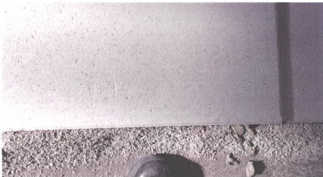
Bild 1. Die zu prüfende Betonoberfläche Velvet Concrete, hydrophbiert im aufgebauten Zustand.