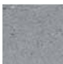
Nr. 10 Naturgrau