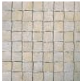
Nr. 56 Giallo

Besonders attraktiv wirkt das AZURO® Pflaster durch eine neuartige Farbschattierung, welche in drei Schattierungsönen lieferbar ist.