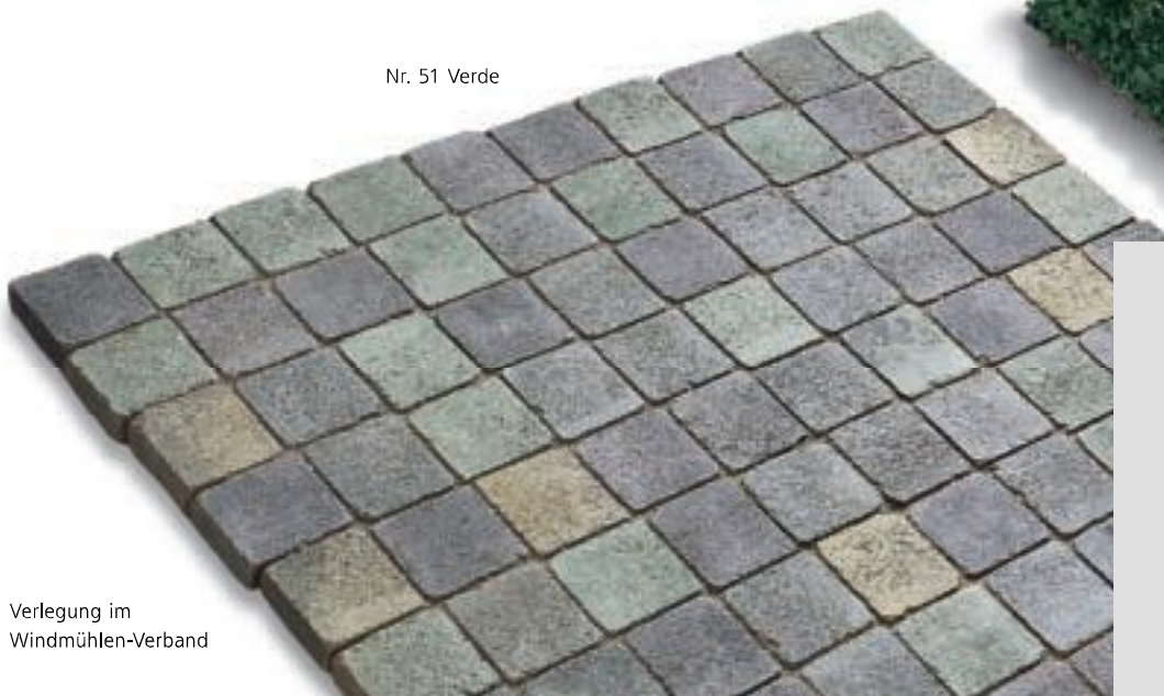
Verlegung im Windmühlen-Verband