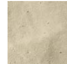
Nr. 28 Cream