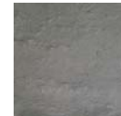
Nr. 12 Graphitgrau

Die Steindicke von nur 60 mm ermöglicht vielfältige Einsatzmöglichkeiten. Durch die unterschiedlichen Steinformate entfallen aufwändige Einschneidarbeiten: Einer passt immer. Ein weiterer Vorteil: die hohe Regenwasser-Versickerungsleistung.