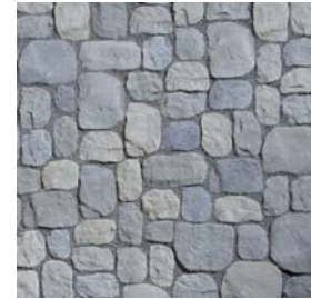
Nr. 133 Antik-Variation