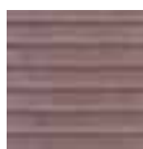
Nr. 126 Palisander