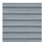
Nr. 93 Mooreiche

Die ausgeprägte grafische Wirkung dieser schlanken Elemente kann Freiräume aufwerten und effektiv mit modernen Gebäudearchitekturen korrespondieren. In der Gartengestaltung stellen sie eine ökologisch sinnvolle Alternative zu Dielen aus Tropenholz dar. Weitere Vorteile sind eine lange Lebensdauer, Formstabilität und ein attraktives Farbenspektrum. Verlegt werden die Steindielen in herkömmliches Bettungsmaterial aus Splitt und Sand.