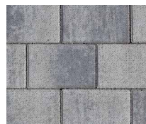
Nr. 150 Silver-Shadow