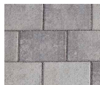
Nr. 151 Brown-Shadow