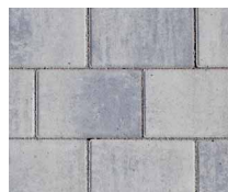
Nr. 150 Silver-Shadow