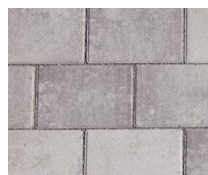
Nr. 151 Brown-Shadow