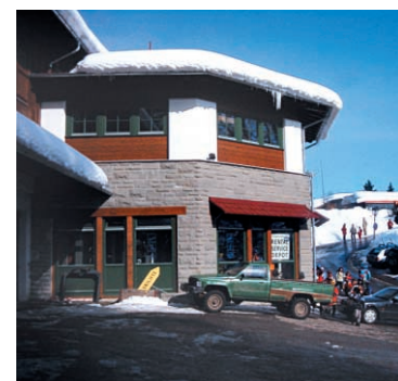
Schöner Anblick mit schönem Ausblick

Ofterschwang ■ „Tatort“ Skilift-Station Ofterschwang im Allgäu: Ursprünglich standen auch Holz, Putz und Naturstein zur Diskussion als über die Verblendung des äußerlich etwas unansehnlich gewordenen Gebäudes auf dem 800 m hoch gelegenen Ofterschwanger Horn entschieden werden sollte. Doch der Bauherr ließ sich vom Architekturbüro Zeller + Engstler Partnerschaften (Sonthofen) überzeugen. Die schließlich gewählte SANTURO® Bossenmauer als Vormauerstein von braun – Ideen aus Stein erwies sich nicht nur als wirtschaftlichste Lösung, sondern auch als ein optisch sehr gefälliges Mauerwerk, das von der Firma Mosaik Natursteine aus Untermittendorf schließlich aufgebracht wurde. Ein kleiner, aber feiner Auftrag für braun – Ideen aus Stein, vor allem jedoch ein schöner Anblick, ein zufriedener Bauherr und nicht zuletzt ein Planer, der erstmals mit Produkten aus Amstetten Erfahrungen sammelte – gute Erfahrungen, wie sich am Ende herausstellte.