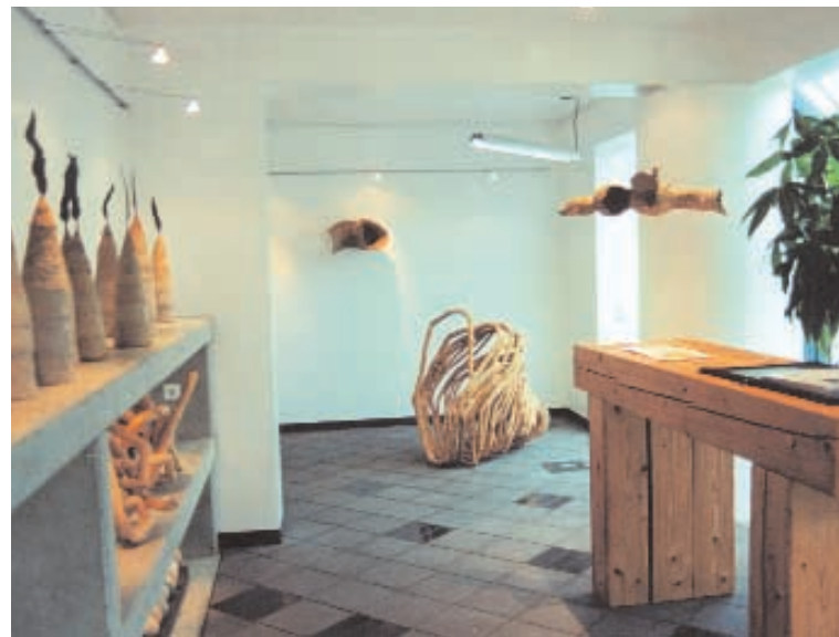
Doppelt genutzt: Kundenberatungsraum in Amstetten