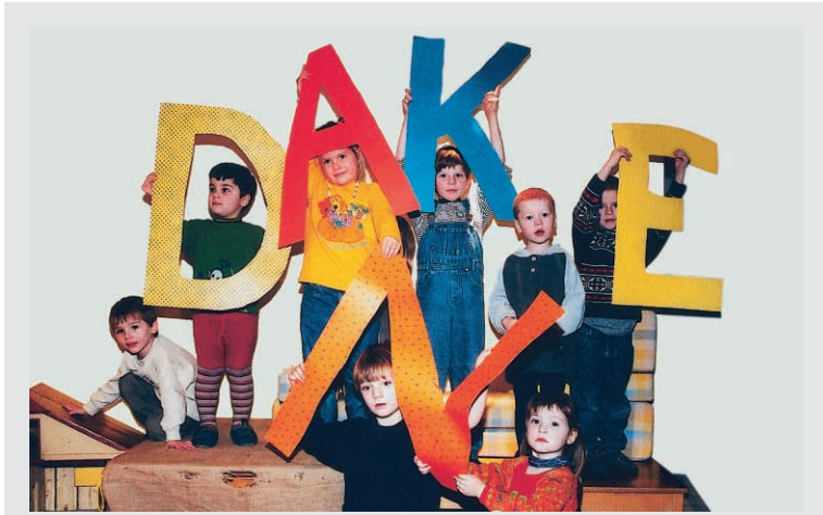
Die Kinder der St. Benno Gemeinde sagen „Dankeschön“