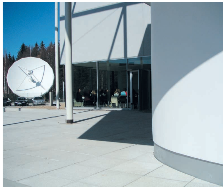
ARCADO®-Pflaster – den Neubau eingerahmt

lamellenkonstruktion abgeschlossen, die die hohe Transparenz der gesamten Anlage unterstreicht. Das Münchner Architekturbüro W.A.S. hatte sich bei der Planung der um die Gebäude liegenden Flächen und Wege für ARCADO® im Format 60/60 sowie für ARCADO® Längsrasenfugensteine, ARCADO® Kandel-elemente und -rinnen entschieden, die von dem Landschaftsbauunternehmen Scherthner GmbH aus Neuried verarbeitet wurden.