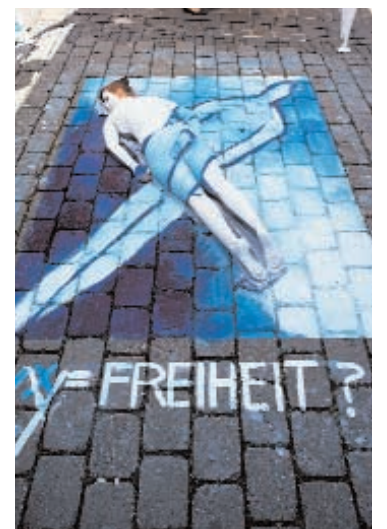
Kunst auf Pflaster 1998

Für die von der Jury prämierten Arbeiten werden Geldpreise zwischen 1000 und 400 (Studenten) bzw. 300 und 100 Euro (Schüler) vergeben. Sponsoren des Wettbewerbs sind neben braun – Ideen aus Stein und der Ulmer Kunststiftung pro arte die Ulmer Brauerei Gold Ochsen, die Sparkasse Ulm, die Südwest Presse Ulm, die Ulmer City und die Südzement Marketing GmbH.