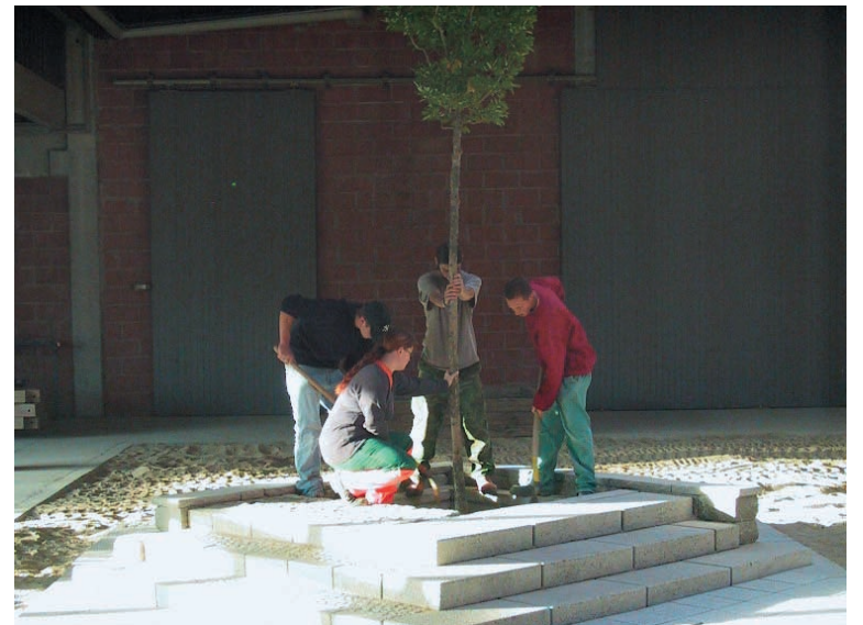
Einbau eines ARPANA®-Baumquartiers