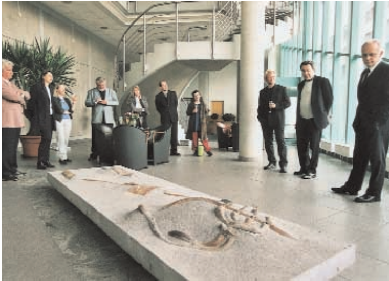
Bewegt die Gemüter: Fossilien moderner Zivilisation?