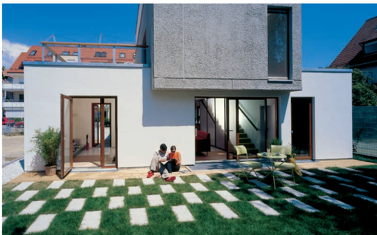
Living X-Projekt: Flexibles Systemhaus für junge Menschen

Wie immer, wenn es um moderne Trends geht, ist auch braun – Ideen aus Stein mit von der Partie. Das Unternehmen war Lieferant des wassergestrahnten Architektursteins TOPAS® AquaSpin, mit dem die Außenanlagen gestaltet wurden. Dieses Produkt ist dank seiner Gestaltungsvarianten und seines unaufdringlichen Fugenbildes besonders geeignet, neue Verlegestrukturen zu realisieren und sich damit in ein neues Konzept wie Living X einzufügen.