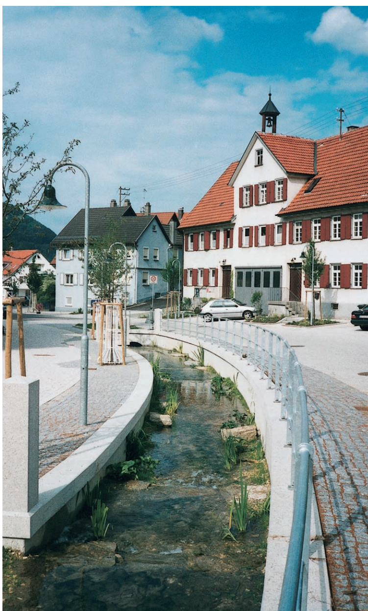
Objektbezogene TESCADO-Rezeptur für das Pflaster rechts und links der Gos